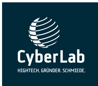
Weißes Logo auf Fotos und dunklen Hintergründen